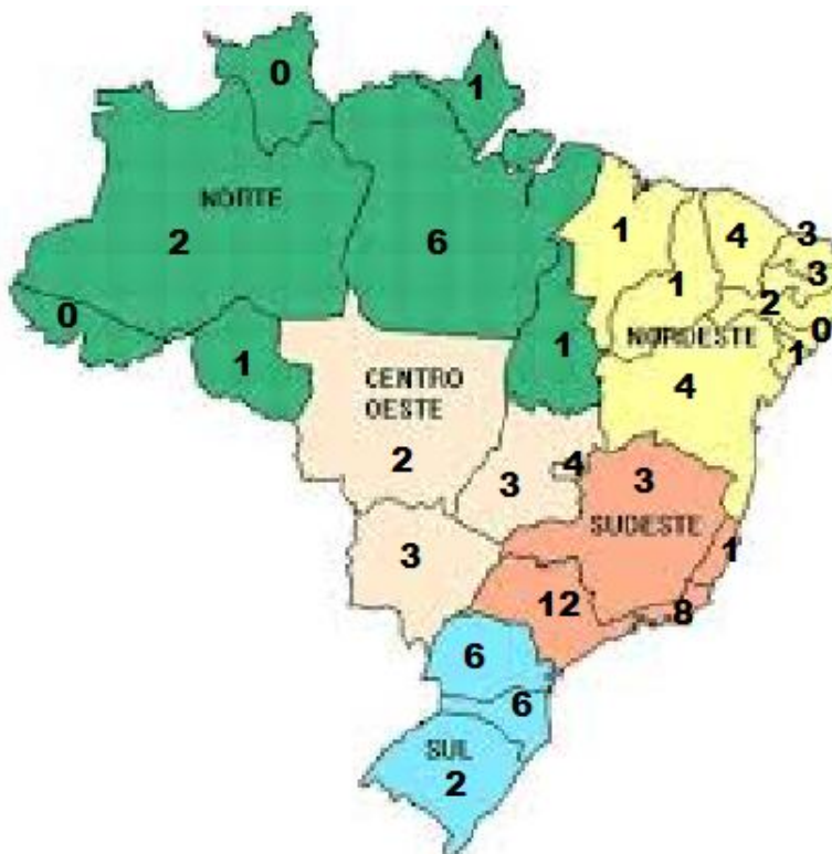
Figura 1: Distribuição de Programas por Região em 2012

A distribuição dos Programas nas Unidades Federativas pode ser visualizada na Figura 1, onde verifica-se que apenas 3 Estados ainda não possuem cursos da Área: Acre, Roraima e Alagoas.